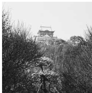
梅の間に大阪城も見える

大阪みどりの百選」にも選ばれている。グリーン会館近く、大阪天満宮の梅も有名。2月27日まで「天満まつり」が行われている(入場料500円)。ライトアップは20日午後8時まで。