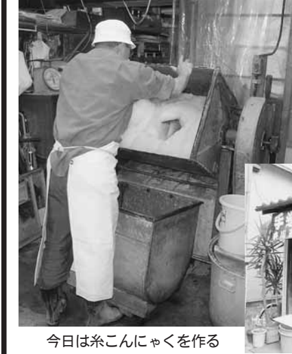
今日は糸こんにゃくを作る

「手作りを教えてください」とやって来ると精魂込めて教える。機械ではつくれない、手で触って加減するおいしいこんにゃくを伝えたいから。こんにゃくの大まかな製造工程は、こんにゃくの粉に水を加えてよく練り、水酸化カルシウムを加えさらに混ぜ合わせる。その後板こん、糸こんにゃくに形を整えていく。最初の練りはかき混ぜ