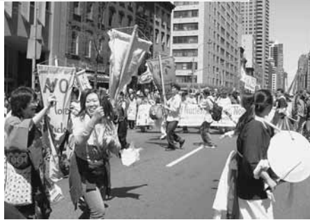
踊りながら「NO NUKES!」と訴える青年

パレードがセントラルパークに到着直後から「NO NUKES! NO WARS!」集会を開催。 秋葉広島市長、伊藤長崎市長らも翌日から始まるNPT再検討会議が「明確な約束」実行にむけ確かな一歩となるよう力を合わせることを呼びかけた。 日本原水協の高草木事務局長は、日本を含め500万を越える核兵器廃絶署名が集まったことを報告。アメリカは「核拡散だけが問題」としているが、最も危険な核大国アメリカこそ率先して廃絶すべき。対米追随の日本が「核の傘」から脱却し廃絶の先頭に立つべきと指摘。今年の原水協禁止世界大会成功で廃絶の新しいページを開こうと訴えた。