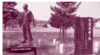
小泉首相とブリーチン大統領の名が刻まれた記念碑