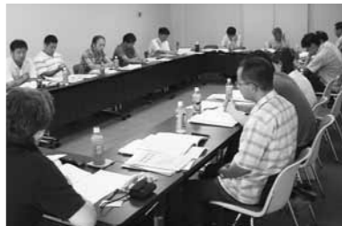
分科会での交流と討論

豊かさ」があったと指摘し、現在の「経済の豊かさ」の指標といわれるGDP（国内総生産：GDPを構成する要素は消費支出、住宅・設備、純輸出など）について発言しました。これからの社会では、「ホスピタリティ・コミュニケーション」の概念が必要。自分だけのことを考えず、他者のこと、弱者や貧困にあえぐ地域の人のことを考えることがいえるのではないかと「豊かさ」という評価のなかにこうした部分がないといけない、と強調しました。 2日目は、「働きがいある職場、賃金、労働条件」分科会、「生活保護職場」分科会、「介護保険」分科会、「税務職