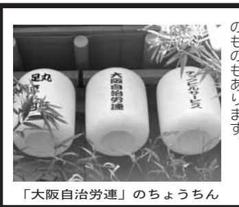
「大阪自治労連」のちようちん