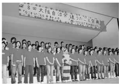
100人の圧倒的なパワーで合唱した藤井寺市職労のみなさん