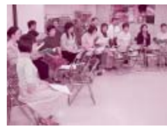
ただいま、本番に向けてレッスン中

年以上、6日・9日に合わせて、毎月1回の地域宣伝をかかさずやってきた伝統が息づいています。私もそんな活動に参加したりして、平和に対する思いはぐくんできたように感じています」。 その衛都連合唱団は今年結成20周年を迎えました。これまで、2、3年のサイクルで定期演奏会を開催してきました。この12月に予定している第8回演奏会は