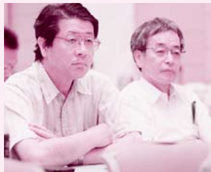
満場一致で、すべての方針案を採択