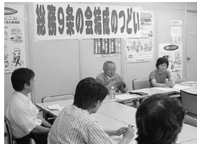
「総務9条の会」結成のつどい（8月31日）

として、人を殺す戦争は許せない。私の祖父から戦争の悲惨さを聞いた。二度と戦争を起こさないために、憲法9条を守りたい」と語りました。