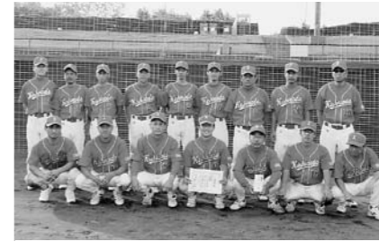
全国大会での活躍が期待される堺市職労チーム

10月4日から6日の日程で、自治労連第19回全国スポーツ大会・バレーボール大会が広島市で開催されました。大会には全国から13チームが参加して熱戦を繰り広げました。大阪代表の堺市職労チームは予選リーグの4ブロックで善戦しましたが、1勝1敗の成績で、決勝トーナメント進出を阻まれました。なお、優勝は都庁職チーム(東京)でした。