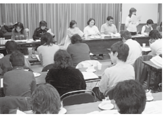
多くの組合員が参加したパート労組の総会

松原市では「集中改革プラン」に公立保育所の民営化も掲げられていました。父母らといっしょになった議会傍聴、反対署名などにとりくみ、「今後の保育所のありかた検討会議」の報告では「公立保育所の民営化もひとつの選択肢」との表現にとどまっています。総会は満場一致で要求や方針を決めました。掲げられた要求は「賃金を時給1300円に」「一時金を正規職員と同率で支給すること」「交通費を支給すること」など7項目。