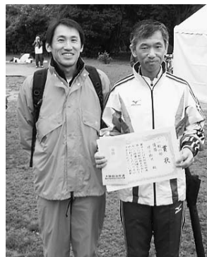
3区でトップにたち、激走を勝ち抜きました