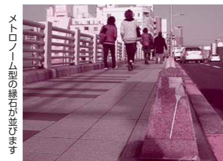
メトロノーム型の緑石が並びます

イムさんもその一人です。1974年に架け替えられた現在の大正橋には、ドイツ人俘虜の歴史にちなんで、欄干にはベートーベンの「第九」の楽譜が、歩道にはピアノの鍵盤がデザインされ、メトロノームの形をした緑石が並んでいます。