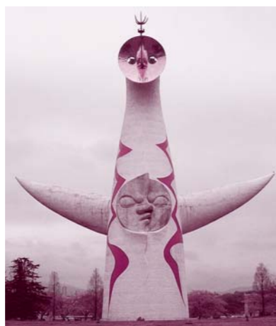
今では大阪のイメージキャラクターに

今から40年前の1970年(昭和45年)、アジアで初めての万博(万国博覧会)が大阪の吹田市で開催されました。「人類の進歩と調和」をテーマに、日本を含む77カ国が参加したこの博覧会は、183日間の期間中に万博史上最多の6400万人を超える人々が入場しました。シンボルとなった「太陽の塔」は岡本太郎氏のデザインによるもので、現在も大阪のイメージを表すキャラクターになっています。「太陽の塔」は「過去」「現在」「未来」をあらわす3つの顔に加え、地下には「地底の太陽」という第4の顔がありました。万博終了後、「地底の太陽」は行方がわからなくなり、万博記念機構は情報提供を呼びかけています。