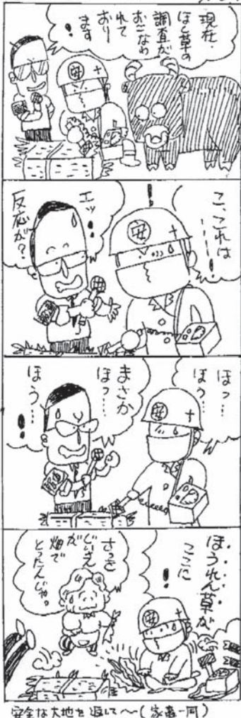
安全は大地を返す〜(家畜一問)