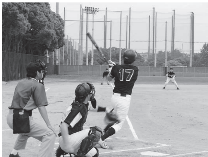
今年も熱い闘いが繰り広げられました

第23回大阪自治労連軟式野球大会が6月14日と30日に万博公園スポーツ広場で開催され、6単組から6チームが参加しました。準決勝では第1試合で守口市職労と寝屋川市職労が対戦。寝屋川が得点を先行し、そのあと守口が得点を取り返す緊迫の展開となり、最終回到守口が一打サヨナラまで迫りましたが同点で終了。規程によりくじ引きで寝屋川が勝利しました。準決勝第2試合は、吹田市職労と岸和田市職労が対戦。岸和田が毎回得点し、7対2で吹田を退けました。