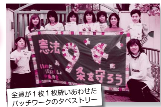
全員が1枚1枚縫いあわせたパッチワークのタペストリー

9条ニュースが発行されたのは、2006年10月9日から。毎月9日に保育所職員に配布され、この5月9日で67号を迎えます。ニュースは手書きで、平和の取り組みや職場のちょっとした記事や載せて紹介したりしていますが、「あー、今日は9日やったね」「憲法9条って知らなかったけど、平和について考えるようになりました」と、職場や若い人たちの話題づくりにもなっているとのこと。