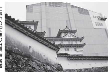
工事中の「天空の白鷺」姫路城