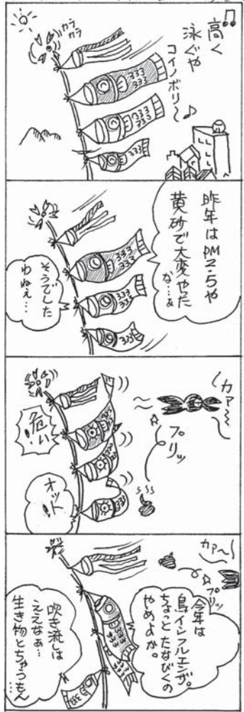
あは5月晴れの空に、色んな魚が泳いでいるのぞき!