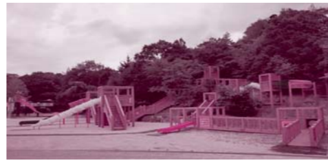
大型遊具もいっぱいあります

大人も子どもも自然の中でのびのびと 公園内にはかつての河内の里山の面影を復元した「河内の里」や「水辺の里」、ユニークな遊具のある「やんちゃの里」があり、大人も子どもも自然のなかでのびのび遊べる公園です。展望台からは、東から南へ二上山・大和葛城山・金剛山・岩湧山・和泉葛城山の雄大なパノラマを望むことができます。ほとんど雑木林なのでこれから紅葉がきれいですよ。栗やアケビなどの山の幸にも出会えるかも...。