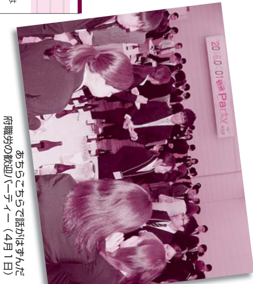
あちこちで話かはずんだ 府職労の歓迎パーティー(4月1日)

発行人/大原 真 編集人/瀧村 博 毎月15日発行(1部10円) 組合員の購読料は 組合費に含まれています。