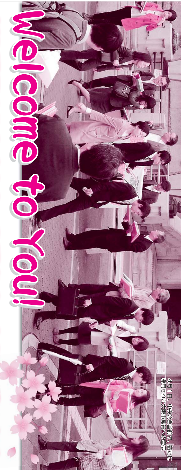
4月1日、中央公会堂前で、新たに採用された大阪府職員への宣伝

ず、署名やカンパに協力していただいた人たちにお礼を言い、自身の経験を報告したいです。また、渡航先にて積極的に署名活動や交流に励み、外国に住む人たちの核兵器廃絶に対するの思いを聞き、日本でその思いを広めていきたいと思