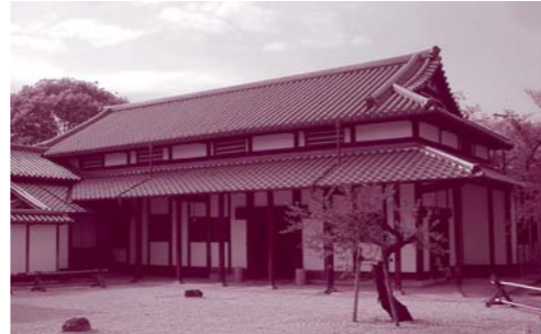
江戸時代の風情を感じさせるたたずまい