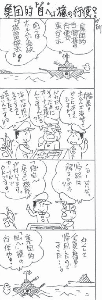
ナナピは「自家入定」といふホウカマサリ。自家的に穿つてくたす。考案ナナピ