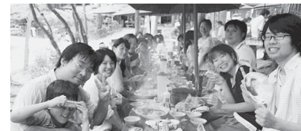
お昼のバーベキュー。お腹いっぱい食べました!!

このバスツアーは、2013年に「自治体に働く女性の全国交流会」が大阪で開催された時に北摂ブロックの交流や組合員拡大などのために始めました。