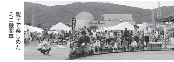
親子で楽しめたミニ機関車

のお菓子のつかみ取りや、子どもランドでの魚釣り、輪投げ、竹馬、銀ちゃん虫、空気てっぽうなどで盛り上げました。また、太鼓サークル「楽鼓」の演奏など運営・設営などの要員でも多くの組合員が奮闘し、まつりの成功を支えました。