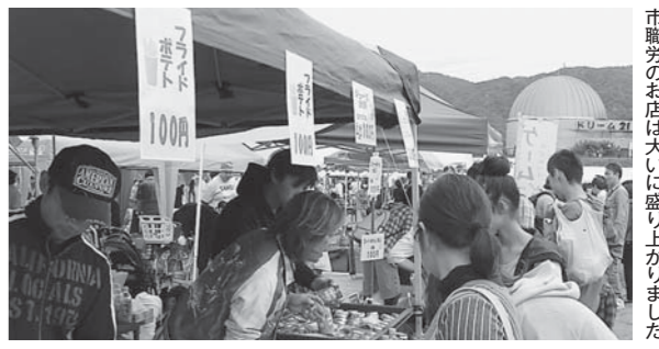
市職労のお店は大いに盛り上がりました

昨年は大きな選挙がつづき、準備期間がなく開催できなかったため、2年ぶりの開催となりました。市職労は、中央のうどん店、病院支部のコインおとし、現評のフライドポテト・スーパーボールすくい、青年部