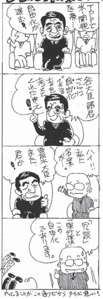
「自由化」の果ては... たくはる