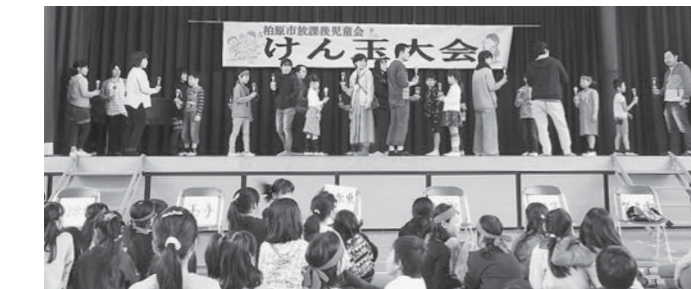
「ろうそくトントン相撲」の親子対決に盛り上がりました