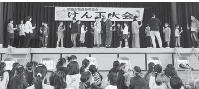
「ろうそくトントン相撲」の親子対決に盛り上がりました

昨年の11月12日、柏原市放課後児童会の「けん玉大会」が柏原東小学校体育会で開催されました。柏原市が財政難を理由に、市主催の大会を中止にしてから10年以上たつ中で、一昨年組合員が中心となり、指導員と保護者会が実行委員会を立ち上げて開催し、2回目となりました。参加児童は90人を超え、保護者と指導員合わせて250人の参加でした。にぎやかな中にも真剣な表情で、「学年別」・「部門別」・「モシカメ」の3競技に取り組み、保護者参加競技は和気あいあいとした交流となりました。