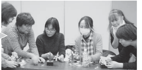
先生のアドバイスを真剣にきく部員たち