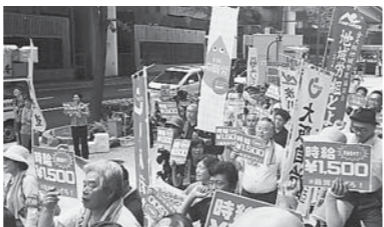
昨年の「最賃引き上げ求める」労働局前行動

今、大阪最賃は時給909円。フルタイム週5日働いても月収14万円ほど。年収175万円弱にしかならず、ワーキングプアを抜け出すこともできません。今すぐ1000円、そして1500円以上に引き上げる取り組みを職場や地域ですすめましょう。