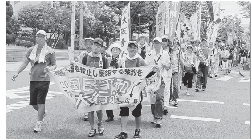
2017年、貝塚市内を歩く国民平和大行進

ギャンブル依存症は、一度陥ると治るのが非常に難しい疾患です。パチンコ店が多い日本では500万人を超えるギャンブル依存症患者がいるといわれる異常な事態になっています。ギャンブルをする金欲しさに、窃盗、強盗、横領、殺人、放火といった事件がひんぱんにおきています。それは、本人だけでなく家族も崩壊させることとなります。さらに政府が今国会で成立を狙っているカジノ実施法案は、カジノ客に対し金銭の貸し付けを行うことを認めているというかつてない異常な法案です。政府はギャンブル依存症対策を口にしますが、カジノそのものをつくらないことが一番の対策です。