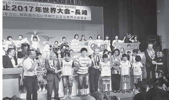
2017年原水爆禁止世界大会の全体会

1945年の原爆投下後、核軍拡競争が始まり、アメリカが1954年3月に広島原爆の1000倍もの威力の水爆実験を行ったことに抗議して、原水爆禁止署名が全国でまたたく間に広がり、翌1955年8月に第1回原水爆禁止世界大会が開催されました。その力は当時の有権者の過半数3200万筆を集める署名を集め、世界をけん引