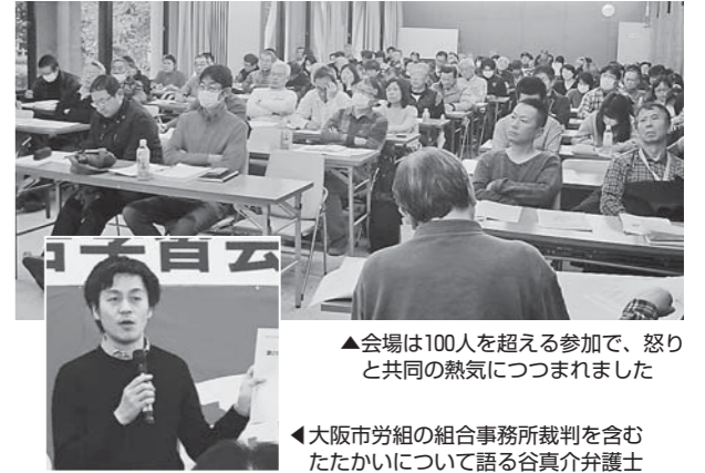
▲会場は100人を超える参加で、怒りと共同の熱気につつまれました

枚方市職労は、職員会館が完成した1971年から1階を組合事務所として使用してきました。ところが現市長は昨年12月27日に「政権や特定政党への批判的な記事を掲載する『日刊ニュースの発行』が使用許可条件に反する」とし職員会館からの退去を通知しました。枚方市職労は団体交渉を申し入れましたが市当局が