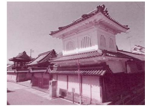
鼓樓（重要文化財）。18世紀後期の建築で、文化7年（1810年）に境内の北東すみへ移築されました

永祿年間に創建 寺内町発展の礎に 富田林興正寺別院は、大阪府内で唯一、国の重要伝統的建造物群保存地区に選定されている富田林寺内町に所在する真宗興正派の寺院です。