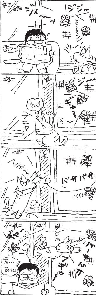
これか、あついな夜(はあ)いよん!

次号は9月13日・14日の定期大会の記事を掲載しますので9月下旬の発行になります