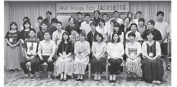
楽しい交流、今年の「青プロ」でも!

づくりプロジェクト「青プロ」にむけて準備がすすめられています。近畿ブロックも2020年6月13日から14日の開催にむけて実行委員会で企画が検討されています。