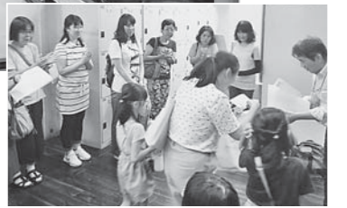
▶表彰式、思わぬ入賞に、親子で喜び姿も