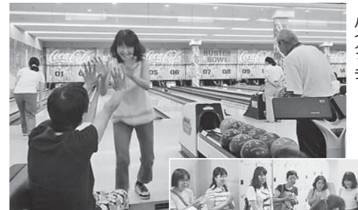
▲ストライク、スベアでハイタッチ!

組合事務所の案内ポスターを見ていたところ、すかさず役員が声をかけ参加となった組合加入1年目の仲間から、大ベテランの役員まで、楽しい交流と適度な運動、そして真剣勝負…と、日々の仕事や組合活動の疲れをいやすひと時となりました。親子での参加もあり、ベテラン役員を含めた3世代での大会は、ストライクやスベアが出るたびに、歓声があがり大盛況でした。表彰式では、スコア上位や子ども部門1位(特別賞)の参加者に景品が贈られました。ひきつづき、地協で連携を強め、幹事会・総会を通じて各単組のたたかひの状況を共有し組織強化・拡大の取り組みをすすめていきます。