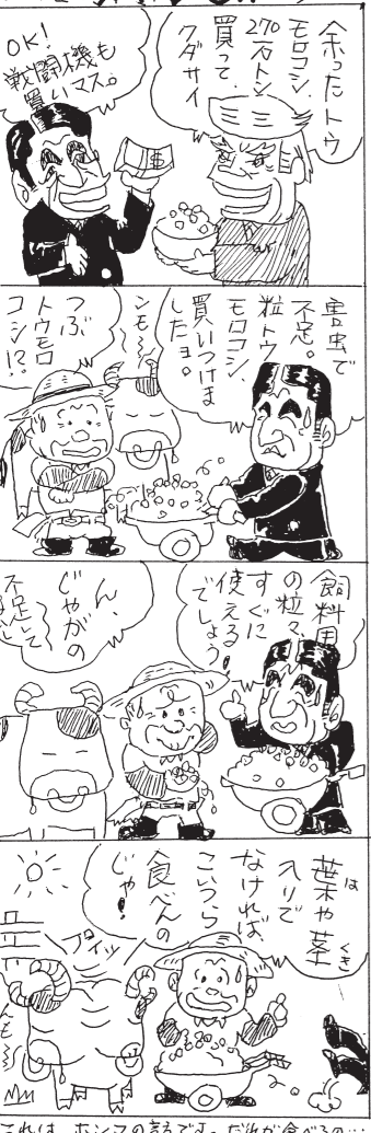
これは、ホンマの儲かる。だから金儲けの...