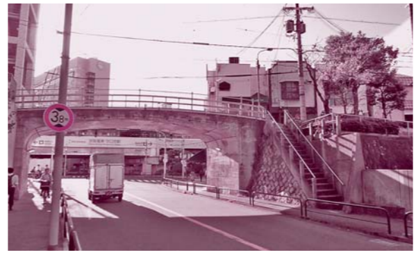
京阪・守口市駅前の文禄堤。現在は生活道路が貫通しています

京阪守口市駅の北側に現存する「文禄堤」は、豊臣秀吉が伏見城と大坂城を結ぶ最短距離の道として、文禄5年(1596)に毛利・小早川・吉川の三家に命じて淀川左岸の堤防を改修・整備してできたものです。堤の長さは約27キロメートルあったと言われていますが、度重なる淀川の改修工事ですほとんどは姿を消し、現在では守口だけで堤の一部が保存されています。