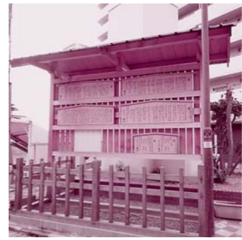
再建された守口宿の高札場