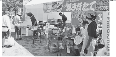
防災・復興支援のひろば

きるほど。舞台では、太鼓や子どもたちのダンス、バンドなどのパフォーマンスが繰り広げられ、焼きそばやお好み焼きなどの模擬店やフリーマーケットも出店。青空のもとで、2万人を超える市民が来場しました。事前の駅宣では、「よっといで祭、楽しみにしています」と、何人もの市民から声をかけられ、ビラもアツという間になくなり、市民手作りのまつりとして、地域に根づいています。