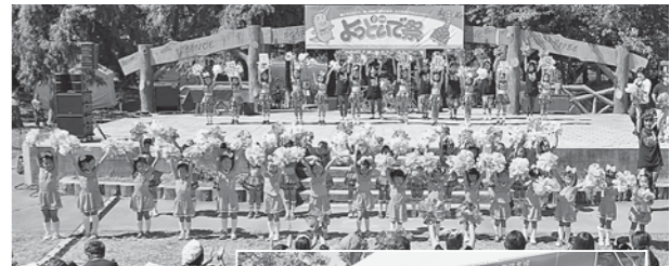
▲台風などで2年連続中止になりましたが、今年は晴天にめぐまれました

市労連は、「防災・復興支援」「平和」「給食」「こども」などのひろば企画を担当しました。「防災・復興支援」のひろばでは、担当課と大船渡市職労の仲間の協力で、防災に強いまちづくりをアピール。大船渡直送の「活ホタテの炭火焼」は、大人気で長蛇の列がで