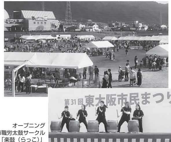
オープニング市職労太鼓サークル「楽鼓(らっこ)」

10月27日、「第31回東大阪市民まつり」が花園中央公園芝生ひろばで開かれました。秋の行楽日和のもと、1万5000人が中央舞台での出し物や子どもランド、模擬店・パザーなどで楽しい一日を過ごしました。 今年は7月には参議院選挙、9月には市長選挙と選挙が続きましたが、準備はその合間をぬってすすめてきました。東大阪市民職労は、模擬店ではうどん店、子どもランドでは魚釣り、けん玉・ポッコリ、くるくる