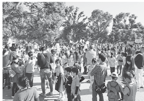
晴天のもと1000人超が参加