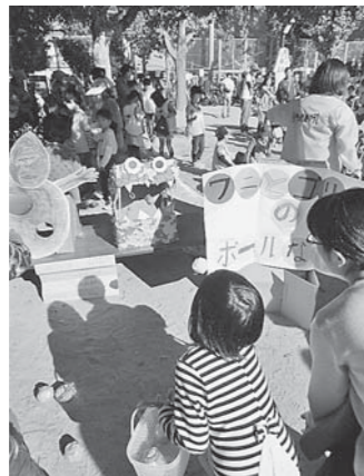
遊びコーナーは子どもたちの手作り