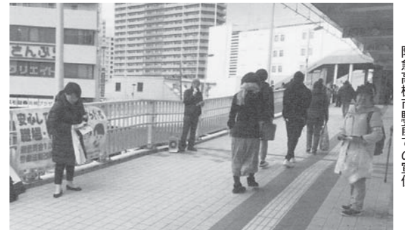
阪急高槻市駅前での宣伝

守りましょう」のビラを配布し、この事態を宣伝で訴えました。2月1日には、高槻日赤労働組合、高槻社保協、大阪労連などが集まり、「高槻赤十字病院を守る会」(仮称)の準備会を発足しました。