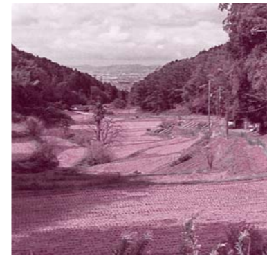
ハイキングコースからみえる棚田

最寄り駅のJR津田駅からは1時間半のお手軽なハイキングコース。山頂付近まで車で行くこともできます（駐車場から30分も歩けば山頂に）。