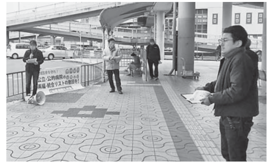
近鉄・河内国分駅前 で 「考える会」 を 宣 伝 す る