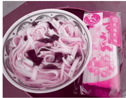
すべらんうどん1人前は 出汁ですべらんシール付です

「すべらんうどん」は、世界初の製法特許によるユニバーサルデザイン食品です。うどんの中央部に複数の切れ目が入っていて、ゆでるとその切れ目が開き、フォークや箸が引っかけやすい仕組みになっています。意識して切れ目に箸やフォークを入れようとすると、かえってなかなか入らないので、ごく普通に食べるというそうです。