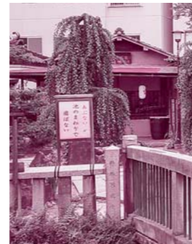
星合の池にかかる石橋を渡ると「星合茶屋」があります（コロナ感染拡大のため現在休業中）

ホームページでは、すべらんうどんを使ったレシピも紹介されています。コロナ禍で大阪市内にも出かけるにいくかと思えます。ぜひ、オンラインショップなどでお求めください（「うどん双樹」で検索を）。