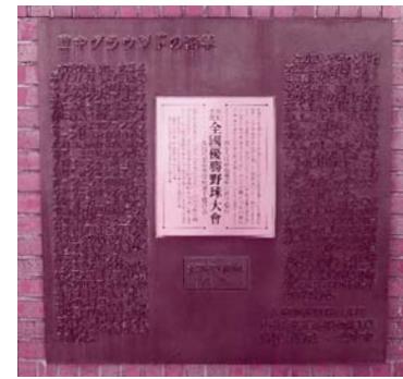
豊中グラウンド跡地にある 高校野球の沿革のレリーフ

豊中グラウンドは、明治43年（1910年）に開通した箕面有馬電気軌道（現在の阪急電鉄）が、大正2年（1913年）5月に建設したも