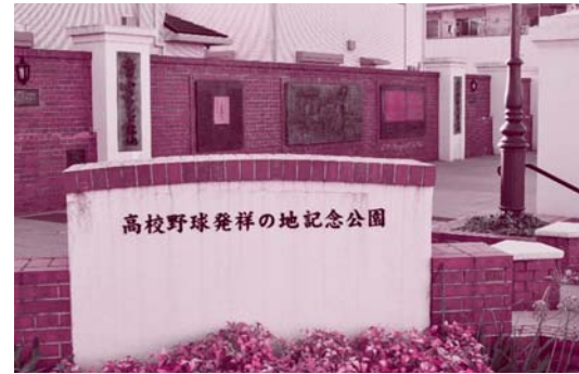
2017年（平成29年）に再整備された高校野球発祥の地記念公園

甲子園で行われるようになったのは、大正13年（1924年）の第10回大会からです。