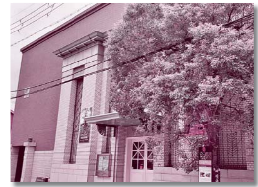
民家の立ち並ぶ通りにあるとは思えないたすまい

が100点以上展示されています。そこには、トラやライオンのように迫力のあるものから、シマウマや鳥類などの展示もあります。また、展示ケースの外にはシロクマやトラのはく製があり、触れることもできますよ。