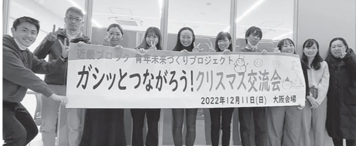
岸和田会場のみんで楽しみました