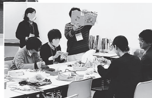
▶好きな編み物をつくっ て、みんなでほっこり

◀「ヒュッゲ (hygge)」 は、デンマーク語で「居心 地のよさ」「心がほっとす る時間」を意味する言葉