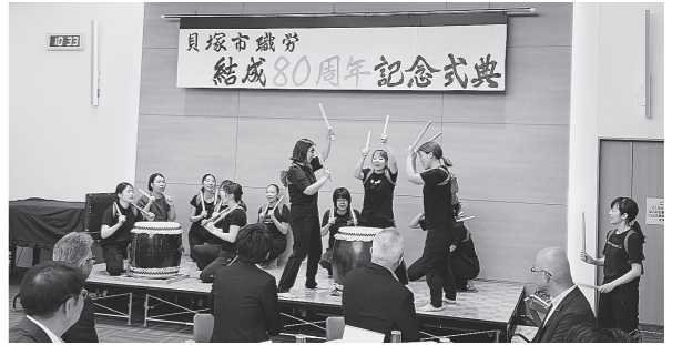
保育所支部による和太鼓演舞